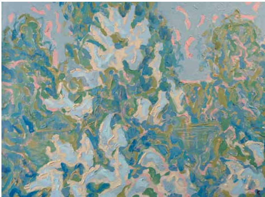
Иванов К.К. «Утро. “Чайка”». 2001, орг., м., 60х80

Лошадь пошла медленнее по мягкой оттаявшей земле, объезжая сидящего на дороге художника и делая большой круг.