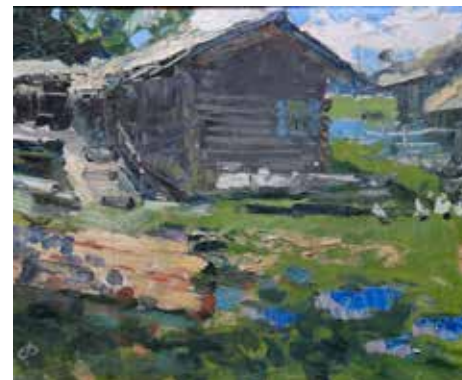
Иванов К.К. «Хутор». 1964, х., м., 54,5х44,5

Снег почти сошел, только кое-где под деревьями, да в ямах лежит тяжелыми плухами. Сквозь кроны деревьев проглядывает весеннее небо. Птицы, прилетевшие с юга, радостно приветствуют друг друга бесконечными песнями. Особенно