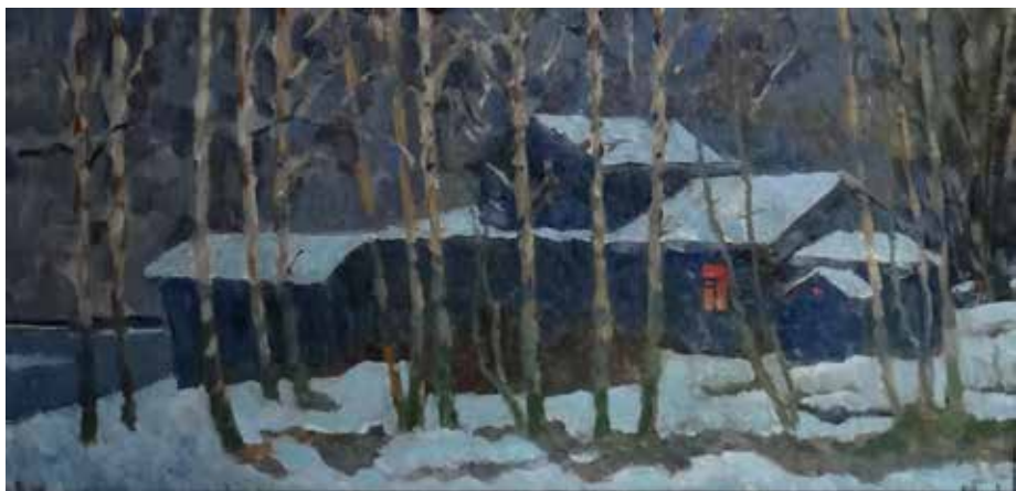
Иванов К.К. «Сумерки. Усадьба Гарусово». 1971, х., м., 36х72