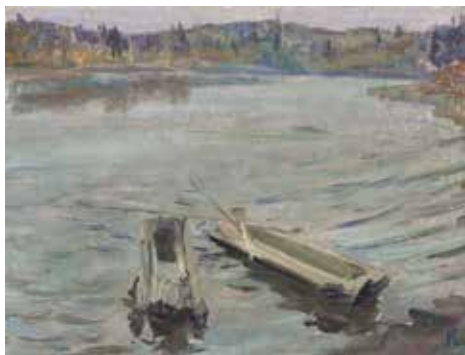
Иванов К.К. «Озеро Видемле». 1965, карт., м., 30х39