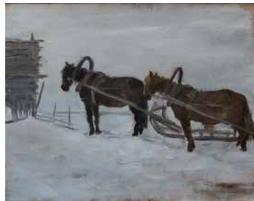
Бялыницкий-Бируля В.К. «Лошадки». 1934, карт., м., 44х55