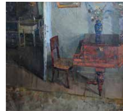
Иванов К.К. «Дача «Чайка». Гостиная». 1968, х., м., 63х71

выделяется звонкая песня зяблика. На чердаке воркуют голуби, кричат грачи и галки, создавая гомон и суету беспрестанными перелетами.