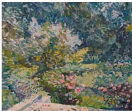
Иванов К.К. «Весна на реке Ижора». 1964, карт., м., 29,5х40