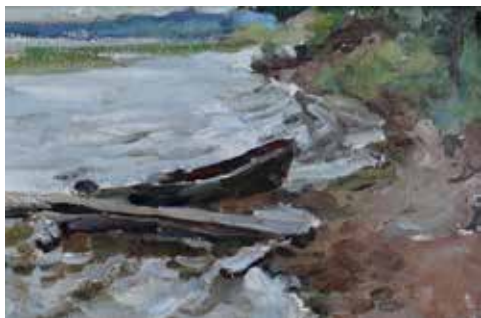
Яковлев Ю.Н. «Дождливый день». Этюд. 1960, карт., м., 22,5х33,5