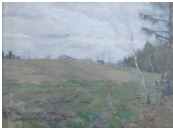
< Бялыницкий-Бируля В.К. «Осенний день». 1936, х., м., 59х79