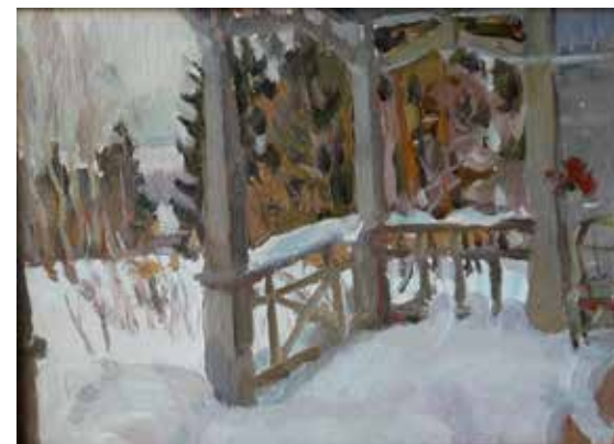
Пятахин Н.П. (1946 г. рожд.) «Терраса в феврале». 1968, карт., м., 25х34