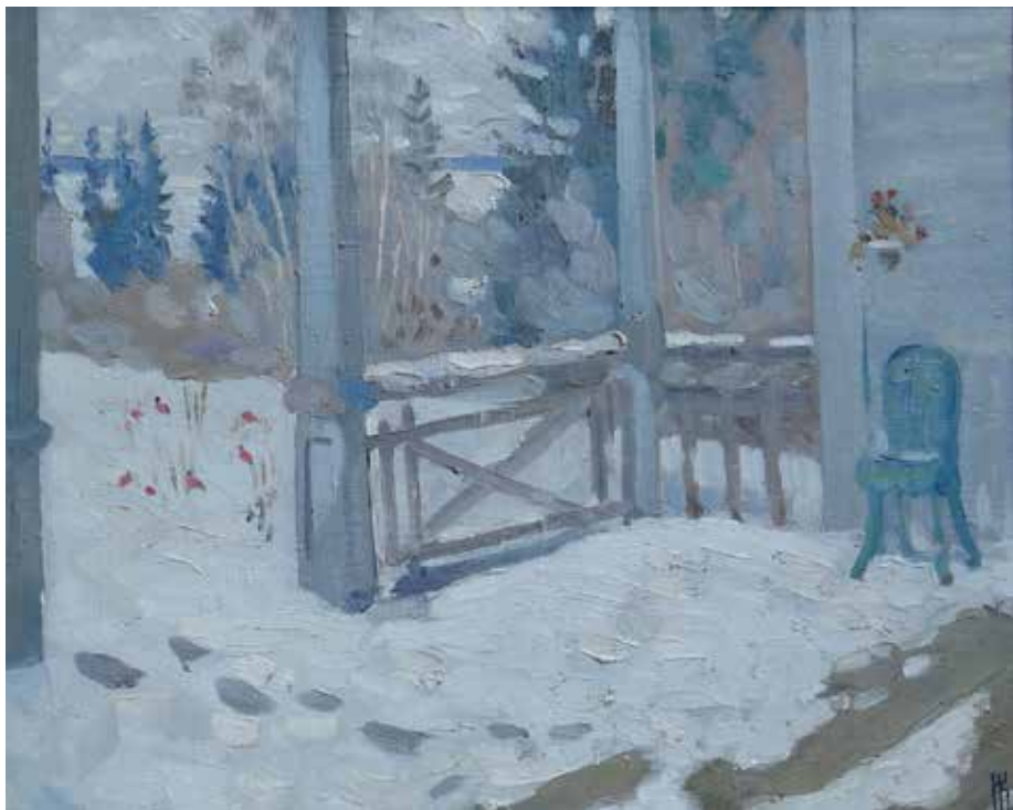
Иванов К.К. «Терраса зимой». 1968, х., м., 40х50

вглядывается в кружево пробудившейся природы, которая заставила трепетать переполненную восторгом чуткую душу.