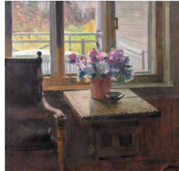
Иванов К.К. «Окно в столовой. Астры». 1966, х., м., 60х61

Х удожник Константин Кириллович Иванов известен не только петербургскому зрителю. С его творчеством знакомы любители изобразительного искусства в России, Белоруссии, а также в зарубежных странах, где неоднократно экспонировались его произведения.