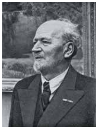
Бялыницкий-Бируля В.К. (1872–1957)