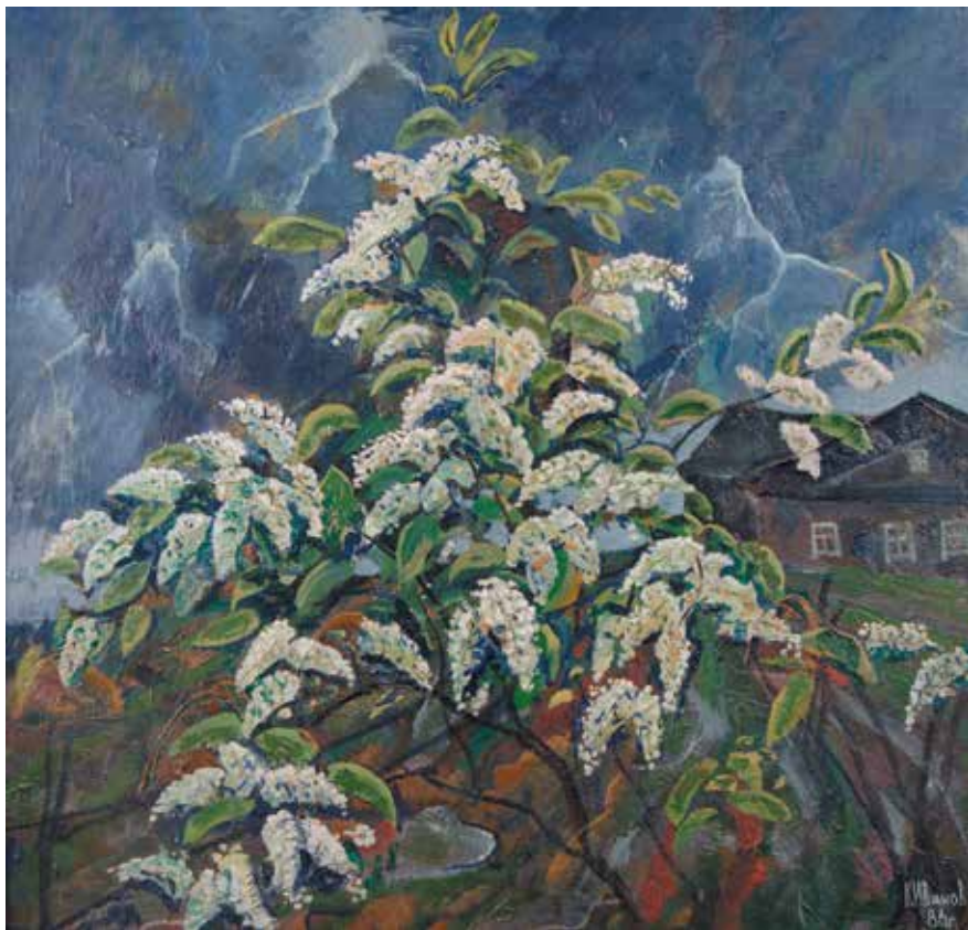
Иванов К.К. «Черемуха». 1986, орг. м., 78x82

шие снежинки. Они, на мгновение прилипая к стеклу, тут же тают. На окнах возникают причудливые рисунки, играющие блесками отражений от дрожащего пламени свечи.