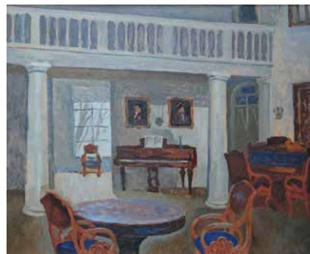
Иванов К.К. «Зал в имении Островно». 1974, орг., м., 61х74.

День обещает быть теплым. Серебриться под лучами солнца, пробивающаяся травка и спешат ручьи, играя всполохами света. Художник, вбирая красоту весны,