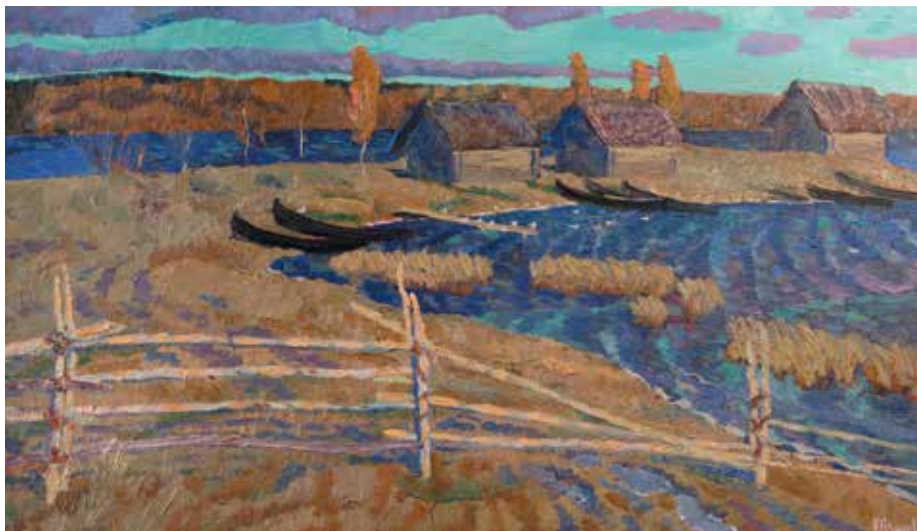
Иванов К.К. «Озеро Кезадра». 1974, орг., м., 53х88