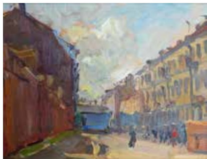
Яковлев Ю.Н. (1937 г. рожд.) «Фонарный переулок». 1961, карт., м., 27х35,5

из-за бугра деревушкой Маяк с ее амбарами, сараями, редкими избами. Еще дальше, у самого горизонта, тянулась деревня Яковлево, за которой – медвежья тропа, ведущая в лесную и далекую – Тупики.