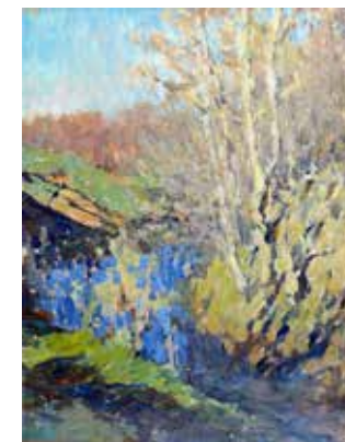
Виноградов О.Г. (1938–2007) «Осень». Этюд. 1961, карт., м., 41х32