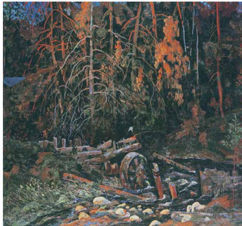
Иванов К.К. «Антошкина мельница». 1981, х., м., 100х110

Начавшаяся морось принесла дождь, перешедший в монотонное тоскливое ненастье. Наступили сумерки.