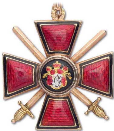
Орден Святого Владимира 4-й степени