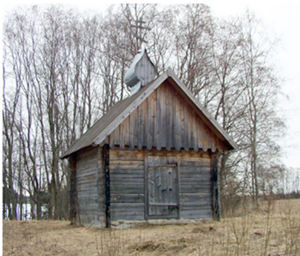
Село Курово. Александровская часовня. 2002 год.