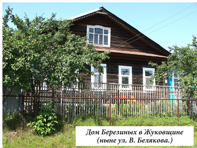
Дом Березиных в Жуковщине (ныне ул. В. Белякова.)

Больше всего из семьи Половинчиковых осталась в моей