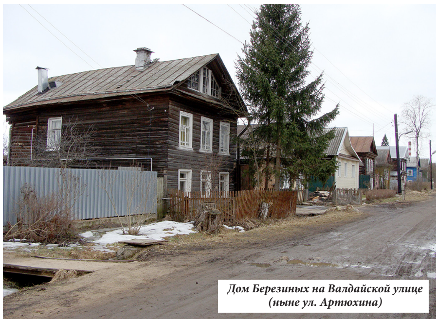
Дом Березиных на Валдайской улице (ныне ул. Артюхина)

В сенях лежали в пыли два больших национальных флага, которые при мне ни разу не вывешивались. Из сеней был вход в небольшую пристройку – заднюю, в