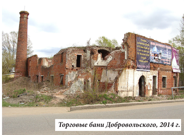
Торговые бани Добровольского, 2014 г.