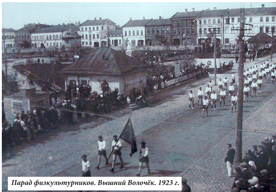
Парад физкультурников. Вышний Волочёк. 1923 г.

Мы редко сохраняем старые газеты, афиши, объявления, квитанции, а ведь это интереснейшие документы, можно сказать, свидетели нашей повседневной жизни. Посмотрите, как строились девять этапов маршрута физкультурэстафеты им. «Вышневолоцкого пролетария», которая проводилась в 1932 году. Интересно, что такое «коммерческая столовая» и что это за «цирк», о котором восемьдесят лет назад знали все вышневолочане?