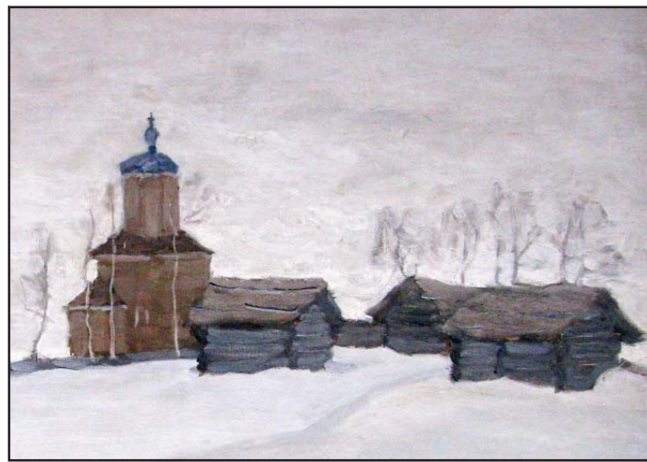
В.К. Бялыницкий-Бируля. «В конце зимы» (1907) (фрагмент). Изображён храм Рождества Христова в с. Николо-Стан