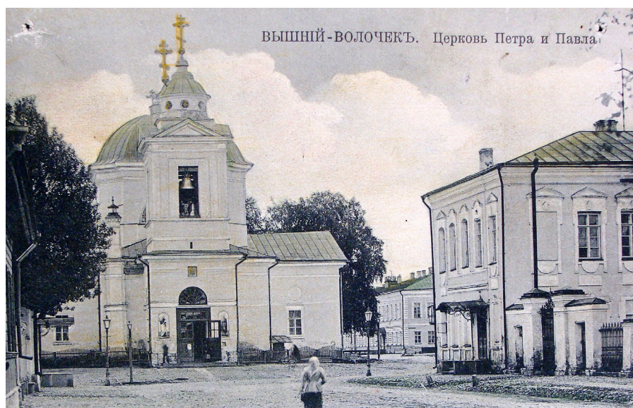
ВЫШНИЙ-ВОЛОЧЕК. Церковь Петра и Павла

22 апреля 2013 года президент подписал указ о проведении в Российской Федерации Года культуры. В документе говорится, что Год культуры будет проведен с целью «привлечения внимания общества к вопросам развития культуры, сохранения культурно-исторического наследия и роли российской культуры во всем мире». Очень правильные слова, если обратиться к состоянию культуры в нашем регионе, в нашем городе. О состоянии памятников архитектуры, например, в Вышнем Волочке вообще говорить не приходится. Часто в средствах массовой информации и от представителей общественности можно услышать слова о низком уровне духовности и нравственности в нашей стране, об отсутствии национальной идеи, идеологии. Не менее часто звучат высказывания и об отсутствии культуры.