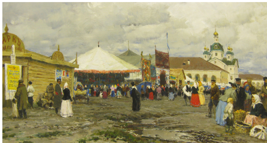
Ю. Подляский «Старый Вышний Волочек», 1953 г. Живописный отдел музея.

(они лишались основного заработка), писали челобитную царю и даже совершали вредительские действия, засыпая канал землёй в ночное время. Но канал был построен. Он успешно проработал до середины 19 века, до открытия железной дороги Петербург–Москва, после чего работа канала стала быстро сокращаться и он был закрыт. Проведение железной дороги тяжело отразилось на жизни мещанства города. Прежде всего, оказалось без работы большое количество жителей, обслуживающих сложное хозяйство канала. Кроме того, открытие дороги одновременно и быстро вызвало ликвидацию ямского (ямщицкого) промысла на шоссе, которым жила целая ямская слобода. К тому времени относятся данные об уменьшении городского населения, выразившемся не только в уменьшении естественного прироста, но и в падении ниже этого уровня, что расценивалось некоторыми современниками