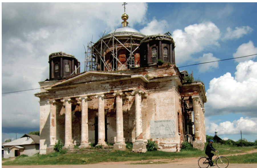
Козлово. Собор Введения во храм Пресвятой Богородицы.