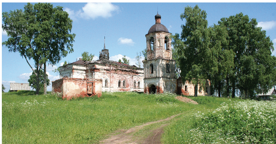
Село Жабны Фировского района. Современный вид церкви Николая Чудотворца.