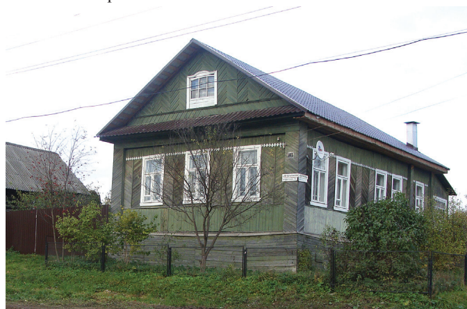
Дом Криденоров. Вышний Волочек, угол улиц Красных Печатников и Бутягина.