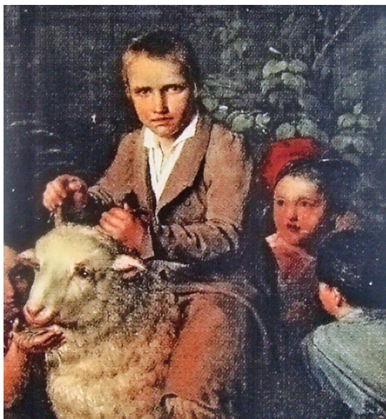
А. Г. Венецианов «Портрет детей Путятинных».