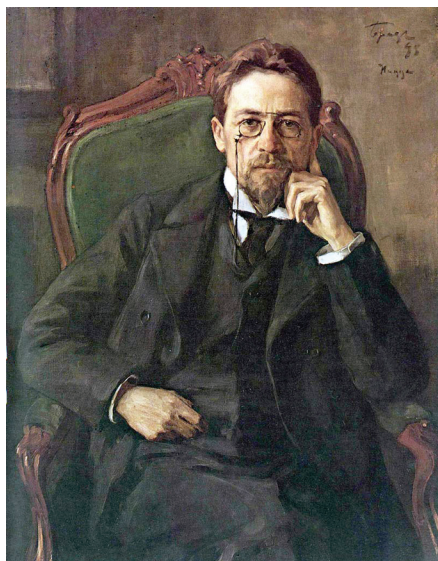
Портрет А. П. Чехова, худ. И. Н. Крамской

В 1896 году Антон Павлович Чехов приезжал к издателю газеты «Новое время» Алексею Сергеевичу Суворину в имение Тасино, неподалеку от Максатихи. Однако подробности их встречи и местоположение дачи до сих пор оставались неопределёнными.