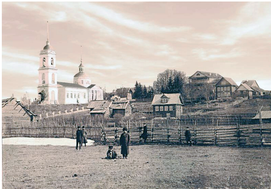
Село Рождество.