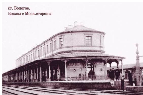
ст. Бологое. Вокзал с Моск.стороны

Комплект подготовлен издательством «ИСТОКИ». Большая помощь в работе была оказана бологовским краеведческим музеем, а также коллекционерами, предоставившими для этого проекта свои собрания. Комплект из 15 сюжетов вышел с подзаголовком «выпуск 2», первое издание вышло в свет в 2009 году и быстро стало редкостью. Издательство благодарит всех, кто оказал какую-либо помощь в работе над выпусками.