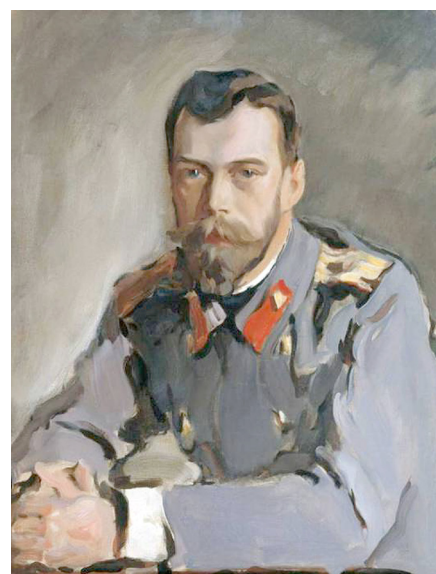
Романов Николай Александрович

Длительное царствование Екатерины Алексеевны (1792–1796) принято считать периодом «просвещенного аб-