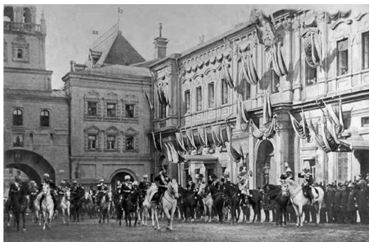
Коронация Николая II