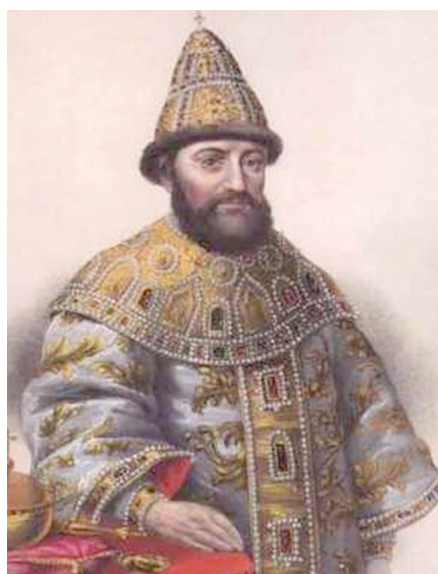
Романов Михаил Федорович

В 2013 году исполняется 400 лет с начала царствования династии Романовых. Девятнадцать ее представителей находились на российском престоле в течение 304 лет. Первым из них стал 16-летний Михаил Федорович Романов (1613–1645), избранный на царство Земским собором в 1613 году. Это событие положило конец Смутному времени, начавшемуся после смерти Федора Иоанновича, сына Ивана Грозного, последнего из Рюриковичей на царском престоле. Смута, изначально вызванная отсутствием «природного» царя, привела к кризису политической власти, затем к развалу экономики, социальной напряженности, опасности иностранного порабощения, поставила под угрозу само существование российской государственности. Ликвидация последствий Смуты – важнейший итог правления первого Романова, точнее двух Романовых, так как титул «великого государя» имел и отец юного царя патриарх Филарет.